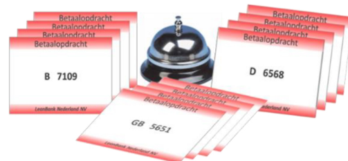
Simulatiegame "De LeanBank NV"