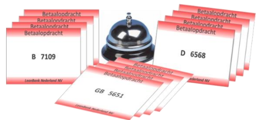
Simulatiegame "De LeanBank NV"