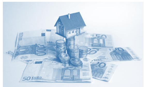
Simulatiegame "De Gulden Daalder"