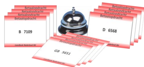
Simulatiegame "De LeanBank NV"