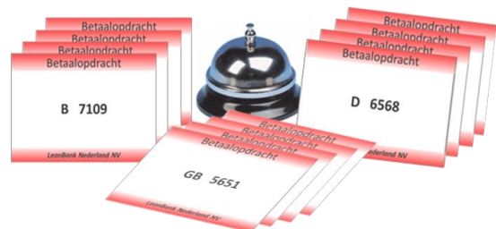
Simulatiegame 'De LeanBank NV'

Verbeteringen realiseren en implementeren